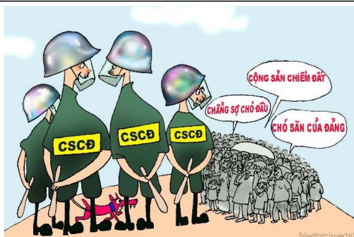
Babui - Danchimviet.net