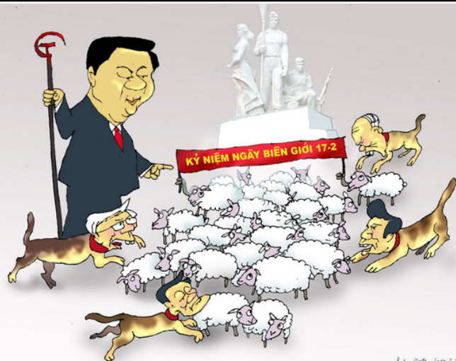
Khi đăng kỷ niệm ngày 4 tốt (Babui - Danchimviet.info)

Xét như một xã hội dân sự, tôn giáo không thể giới hạn trong chùa chiền, thánh thất mà cần bung ra giữa trần đời; không thể bằng lòng với việc rao giảng giáo lý trong cộng đồng giáo hội mà phải đòi cho được rao giảng trên đường phố, giữa xã hội để hóa giải những tà thuyết; không thể bằng lòng với việc dạy dỗ tín đồ mà phải đòi được giáo dục giới trẻ và quần chúng; không thể bằng lòng với bác ái cứu trợ mà còn phải đòi thực thi bác ái giải phóng, nghĩa là không chỉ giúp kẻ đói cơm áo, lâm bệnh tật mà còn giúp những kẻ bị chà đạp nhân phẩm, bị tước bỏ nhân quyền; không thể bằng lòng với việc lên tiếng về công lý hòa bình cách chung chung mà còn phải hành động; chức sắc và tín đồ, mỗi hạng theo một cách thức riêng. Có như thế, tôn giáo mới thể hiện được nhiệm vụ của mình là đem đạo vào đời, lấy đạo cứu đời, và mới mời gọi được mọi người đi đến Chân Thiện Mỹ tuyệt đối. BAN BT