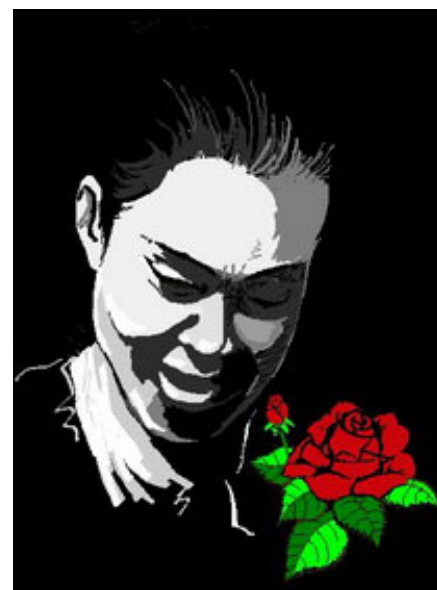
Bước ra từ bóng tối. Vẫn nụ cười trên môi (Tranh và thơ của Kỳ Cực)