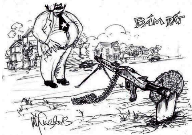
Bám đất (Kỳ Cục - Danchimviet.info)

Việc đàn áp dữ dội năm 2008 đối với Giáo phận Công giáo Hà Nội trong vụ Tòa Khâm sứ và đối với Dòng Chúa Cứu Thế trong vụ Thái Hà, mới đây là đối với Giáo phận Công giáo Vinh trong vụ Mỹ Yên (thậm chí Ban Tôn giáo chính phủ đã phải cấp thời sang Vatican từ ngày 15 đến 20-09 để yêu cầu Tòa thánh trừng phạt Giáo phận này và trừng phạt cả Dòng Chúa Cứu Thế). Rồi bao nhiêu cuộc đàn áp đối với các Giáo hội chính truyền khác tại VN mấy thập niên qua, tất cả đều xuất phát từ chỗ nhà cầm quyền thấy các Giáo hội này (cùng với những tổ chức trực thuộc bên trong) đều là những xã hội dân sự đúng nghĩa, vì các thành viên liên kết chặt chẽ với nhau bởi những mục tiêu cao cả, họ lại luôn độc lập cách nào đó với nhà cầm quyền (dù nhà cầm quyền tìm cách khống chế và kiểm soát họ qua Pháp lệnh lẩn Nghi định tôn giáo), luôn phê phán nhà cầm quyền trực tiếp hoặc gián tiếp qua việc đòi hỏi tự do tôn giáo và tranh đấu cho nhân quyền dân chủ. BAN BT