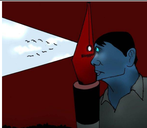
Thiện tai của Một Góc Nhìn Khác (Babui - DCVonline)