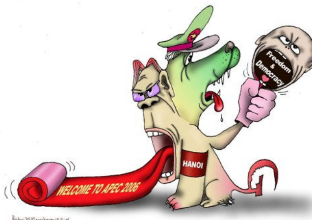
Tác giả: Babui