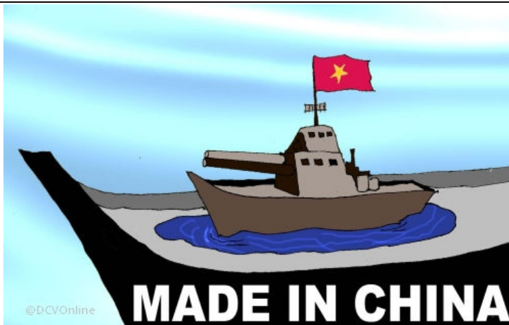
Chủ quyền Biển Đông (Babui - DCVOnline)