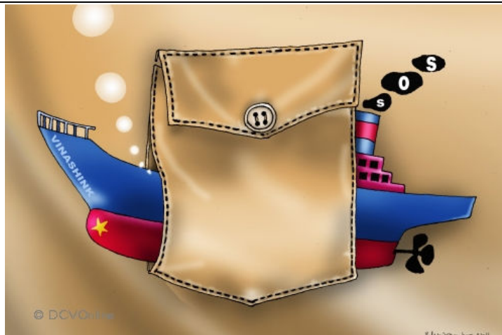
Vinashin, quả đấm thép (Babui - DCVOnline)