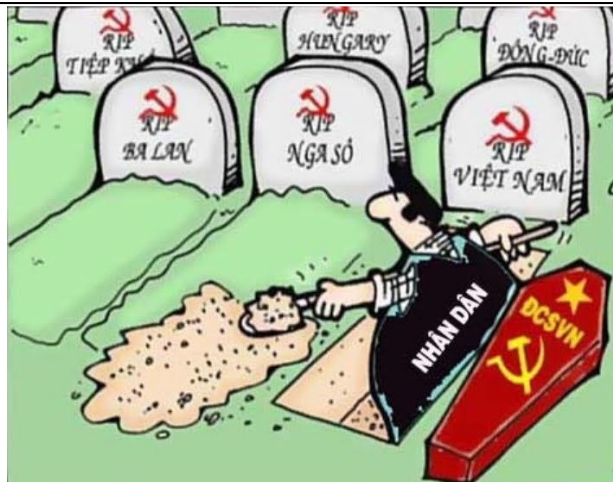
Khai tử Việt Cộng